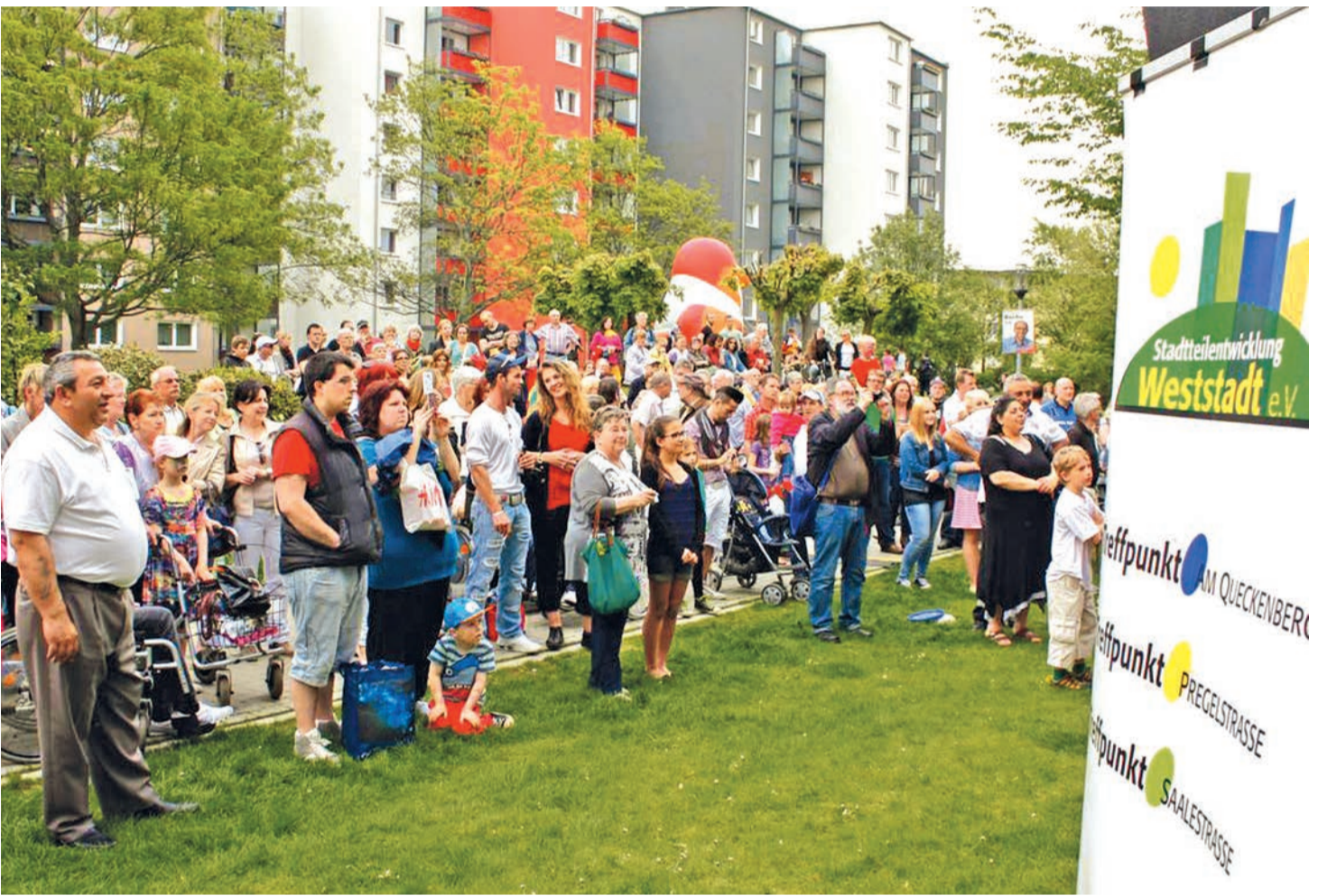
Die betreuten Nachbarschaftstreffpunkte im Stadtteil Braunschweig-Weststadt bieten eine Fülle von Aktionen und Veranstaltungen. Viele Bewohner bereichern das Programm inzwischen auch mit eigenen Initiativen.

Baugenossenschaft ›Wiederaufbau‹ eG, Braunschweig; Braunschweiger Baugenossenschaft eG; Nibelungen-Wohnbau-GmbH Braunschweig; Stadt Braunschweig