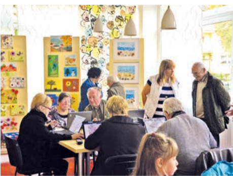
Computerkurs im Treffpunkt 'Am Queckenberg'

ment für die Erhaltung und Verbesserung der Wohnverhältnisse in der Weststadt. Beispielgebend ist aus Sicht der Jury, dass dieses Projekt der Wohnungswirtschaft und der Stadt verlässliche und nachhaltige Voraussetzungen für die Stabilisierung der Nachbarschaften geschaffen hat.