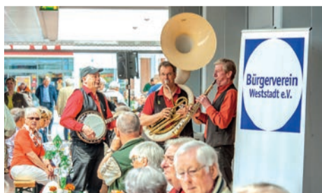
Die Treffpunkte sind vor allem Kommunikationspunkte.