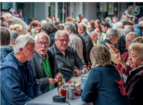
Austausch beim Bürgerbrunch